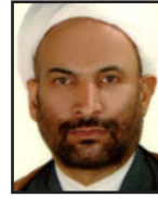
مصاحبه با یک روحانی پیرو خط امام (ره)