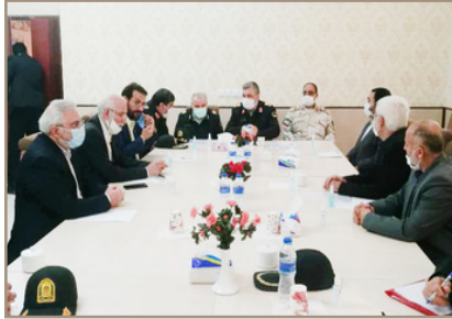
لوح تقدیر و هدایایی به این عزیزان اعطاء کرد.

سردار اشتری فرمانده کل انتظامی ج.ا.ا. در سفر خود به خوزستان با حضور در جمع بازنشستگان، با آنها دیدار و گفت و گو کرد.