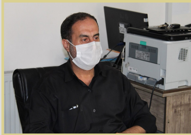
از تسهیلات قرض الحسنه استفاده نکرده اند.

مسئول توانمندسازی و خدمات رفاهی کانون شرق استان تهران گفت: پیرو هماهنگی با سازمان باننشستگی نیروهای مسلح استان تهران و کانون باننشستگان ناجا و فرمانده انتظامی ویژه شرق استان تهران به ۲۴۷ نفر تسهیلات قرض الحسنه و ۱۰۴ نفر وام مراحه (۱۸ درصد) و ۳ نفر وام اشتغال و ۷ نفر کمک بلا عوض اعطا گردید.