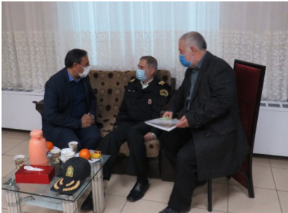
آنها تاکید کرد.

در پایان دیدار سردار خرم نیا با اعطای هدایایی از بازنشستگان حاضر در جلسه تجلیل کرد.