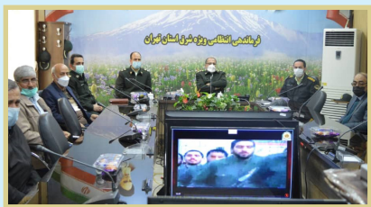
اسلامی از پیشکسوتان حاضر در مراسم تقدیر بعمل آوردند.

مراسم گرامیداشت سالگرد تشکیل کمیته های انقلاب اسلامی با حضور معاون هماهنگ کننده فرمانده انتظامی ویژه شرق استان تهران سرهنگ ناظمی فر، معاون نیروی انسانی، نماینده عقیدتی سیاسی، نماینده حفاظت فرمانده انتظامی ویژه شرق استان تهران و جمعی از پاسداران کمیته انقلاب اسلامی شرق استان تهران در سالن فجر ستاد استان برگزار گردید.