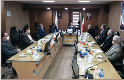
سال مبالغی بعنوان کمک معیشتی پرداخت شود.

کمیسیون رسیدگی به وضعیت بازنشستگان نیازمند با حضور مدیر ارشد بازنشستگی نیروهای مسلح، مدیر خدمات رفاهی نیروهای مسلح استان و روسای کانون های بازنشستگی قزوین در اداره کل ساتا استان برگزار شد.