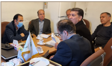
فرزندان بازنشستگان، وام جعاله و دیدار و سرکشی ها بحث و تبادل نظر گردید.

جلسه شورای هماهنگی روسای کانون های نیروهای مسلح غرب استان تهران در دفتر کانون برگزار شد.