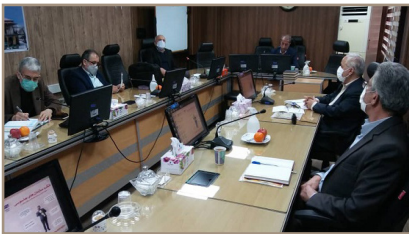
الله ۲۲ بهمن و اعطای جوایز به نفرات اول تا سوم بود.

هشتمین جلسه شورای هماهنگی روسای کانون های نیروهای مسلح استان قزوین در دفتر مدیر کل تامین اجتماعی نیروهای مسلح استان قزوین برگزار گردید. در این جلسه که با حضور روسای کانون های بازنشستگان نیروهای مسلح استان، مدیر کل تامین اجتماعی و مدیر ارشد بازنشستگی نیروهای مسلح استان برگزار شد، پیرامون مسابقات اعضای وابسته ورزشکار نیروهای مسلح به مناسبت گرامیداشت یوم