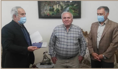
غرب استان تهران دیدار بعمل آمد به رسم یاد بود هدایایی به این بازنشستگان اهدا شد.

مسئول امور خدمات رفاهی کانون بازنشستگان غرب استان تهران از دیدار با ۴۳۶ بازنشسته در سال ۱۴۰۰ خبر داد.